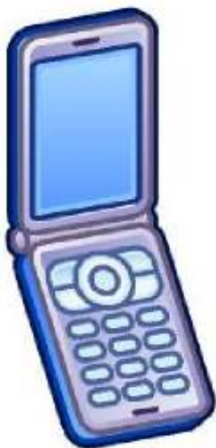
Teléfono móvil tipo concha