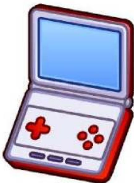
Consola de videojuegos 2