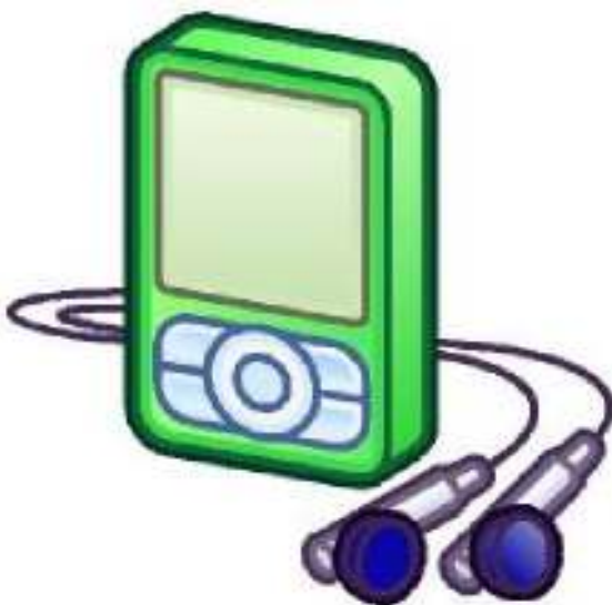
Reproductor de MP3