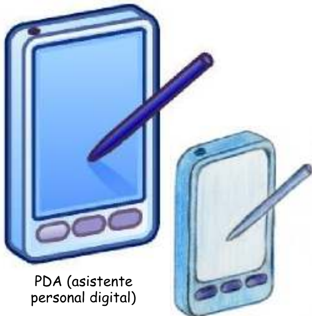
PDA (asistente personal digital)

Instrucciones: Dibuja un boceto de los objetos de las ilustraciones. Recuerda que un boceto es un dibujo a mano alzada, no debes utilizar ninguna herramienta de dibujo, sólo lápiz y goma. Puedes acabar tus bocetos sombreándolos o pintándolos con lápices de colores.