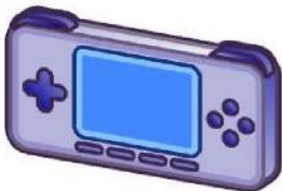
Consola de videojuegos 1

Instrucciones: Dibuja un boceto de los objetos de las ilustraciones. Recuerda que un boceto es un dibujo a mano alzada, no debes utilizar ninguna herramienta de dibujo, sólo lápiz y goma. Puedes acabar tus bocetos sombreándolos o pintándolos con lápices de colores.